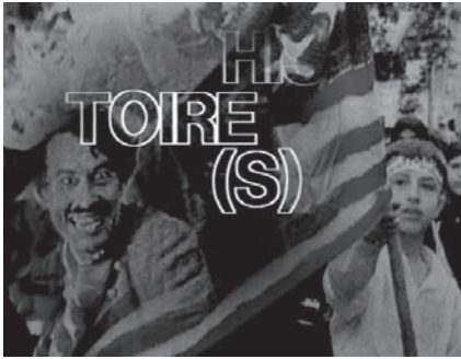
Abbildungen 3–4 HISTOIRE(S) DU CINÉMA von Jean-Luc Godard.