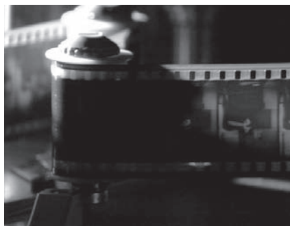
Abbildungenn 1–2 HISTOIRE(S) DU CINÉMA von Jean-Luc Godard.