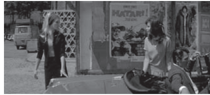
Abbildungen 1–2 LE MÉPRIS: Das Kino ist eine Erfindung ohne Zukunft und lebt seit über hundert Jahren.

die Ausdrucksmöglichkeiten und Funktionsweisen des Mediums im Zentrum des Interesses. Der Titel einer bekannten Aufsatzsammlung des französischen Filmkritikers und -theoretikers André Bazin gibt die Ausgangsfrage der Filmtheorie gut wieder: Qu'est-ce-que le cinéma? – Film und Kino, was ist das (eigentlich genau)? Wie erzeugt der Film auf der Grundlage der fotografischen Bilder in Bewegung einen Realismuseffekt? Mit welchen Mitteln erzählt er seine Geschichten und wie unterscheidet er sich darin vom Theater oder der Literatur? Wie lassen sich die verschiedenen Gattungen und Filmgenres beschreiben? Wie sprechen sie ihre Zuschauer an?