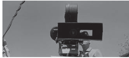
Abbildungen 3–4 LE MÉPRIS: Der Blick durch die Kamera wird zum Blick in die Kamera.

politisierteres Kino in Westeuropa (Bundesrepublik Deutschland, Schweiz, Großbritannien und Frankreich) und in den USA. Film wird in diesen Strömungen als ein geeignetes Medium verstanden, um politische Botschaften zu transportieren oder das Publikum zur politischen Diskussion anzuregen. Das Spektrum zieht sich vom mitreißenden Politthriller über ein Kino als Mittel der Opposition (etwa im New British Cinema) bis hin zum spröden Counter-Cinema, das konventionellen Formen zutiefst misstraut. Im Black Cinema USA oder im französischen Cinéma beurteilen sich bisher stumme Minderheiten und finden im Film ein Mittel zum Ausdruck ihrer eigenen Identität.