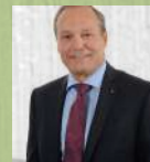
Jörg Kündig Präsident Verband Gemeindepräsidien Kt. ZH Vizepräsident Verband Schweizer Gemeinden Gossau ZH