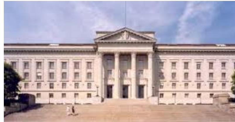
BGE 127 IV 122

«Wahrung berechtigter Interessen setzt voraus, dass die Tat ein zur Erreichung des berechtigten Ziels notwendiges und angemessenes Mittel ist, sie insoweit den einzig möglichen Weg darstellt und offenkundig weniger schwer wiegt als die Interessen, welche der Täter zu wahren sucht.»