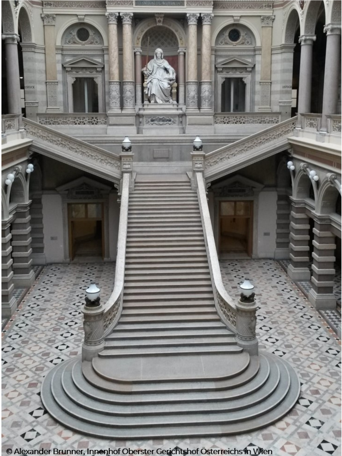
Innenhof Oberster Gerichtshof Österreichs in Wien