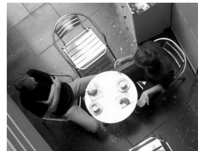
Gegenseitiger Austausch ist eine wichtige Strategie auf dem Weg zum erfolgreichen Studienabschluss.