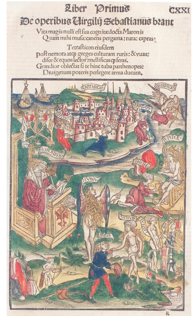
Holzchnitt der Vergil-Ausgabe von Sebastian Brant (1502)