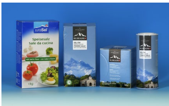
Sale da cucina fluorato e iodato.

I fluoruri sono presenti in piccole quantità nell'acqua potabile e negli alimenti. La loro concentrazione è però troppo bassa per poter proteggere i denti dalla carie. Per prevenire in maniera efficace la carie, dal 1983 in Svizzera è in vendita il sale da cucina iodato e fluorato (p. es. JuraSel: pacchetti con la striscia verde, contenenti lo 0,025 % di fluoruro). Come misura di prevenzione di base si consiglia inoltre l'uso giornaliero di un dentifricio fluorato.